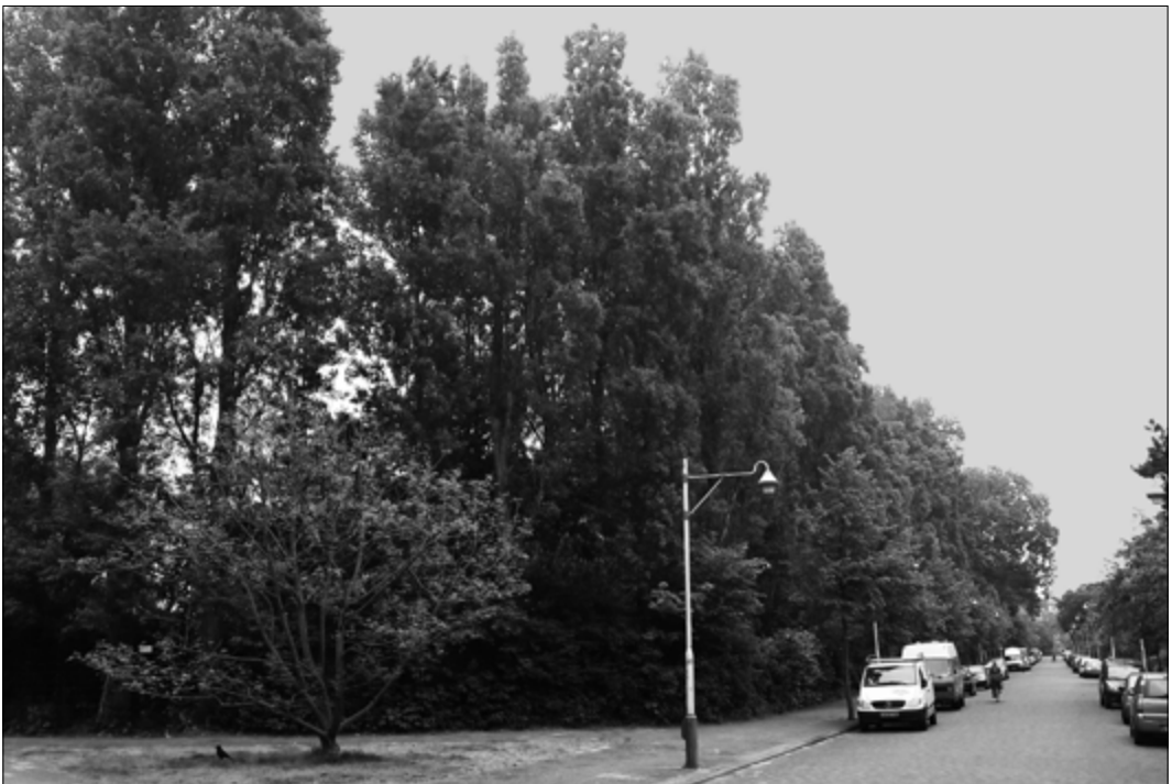
Een deel van de 'riskante' populieren aan de Houtrustlaan

Op plekken met veel onveilige populieren, zoals bij de Houtrustlaan, wil de gemeente eerst met omwonenden in gesprek, waarbij ervoor kan worden gekozen om bepaalde bomen niet te kappen, maar intensief te snoeien. Dit is het zogeheten 'kandelaberen', waardoor de bomen