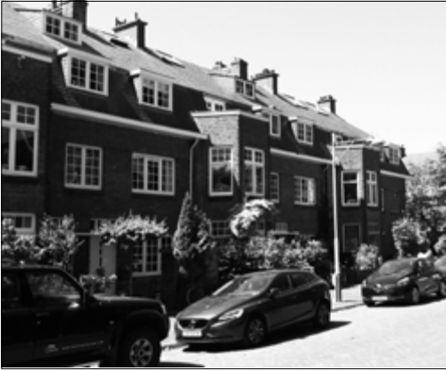
Een rij 'slakkenhuizen' aan de Houtrustlaan

mijn Franse periode verwacht ook in Nederland als fysiotherapeut aan de slag te kunnen, maar mijn opleidingspapieren waren hier helaas niet geldig.”