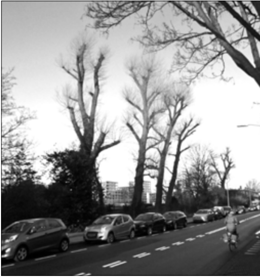
Populieren aan het begin van de Sportlaan die enkele jaren geleden zijn gekandelaberd en daarna weer begonnen uit te lopen.

er na de snoeibeurt als een ranke kandelaar uit komen te zien. Een aantal jaren geleden is dat onder meer al gebeurd bij enkele populieren langs een voetbalveld aan het begin van de Sportlaan. Ook zijn de afgelopen jaren aan de Laan van Poot ter hoogte van Tennispark Houtrust al een paar populieren weggehaald.