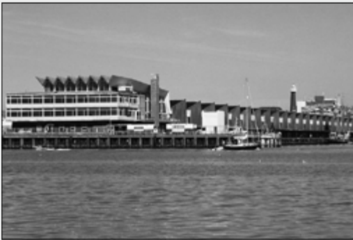
De Visafslag met links het Zeemanshuis, gezien vanuit de haven.

Scheveningse haven is namelijk 24 uur per dag, onafhankelijk van het getij, voor vissersschepen toegankelijk. Hierdoor én door de gunstige ligging ten opzichte van het achterland is Scheveningen voor veel grote en kleine vishandelaars zeer interessant. Dat maakt deze haven ook aantrekkelijk voor de – grote en kleine - aanvoerders, ook van buitenlandse origine.