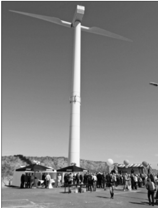
Hiermee begon het allemaal: de reactivering van de afgeschreven Eneco-windmolen bij het voormalige Norfolkterrein

„Premier Rutte noemde de energietransitie onlangs de grootste nationale opgave sinds de naoorlogse wederopbouw en ik zeg hem dat graag na”, aldus Liesbeth van Tongeren, die in het eerste decennium van deze eeuw zeven jaar directeur van Greenpeace Nederland was. „We moeten alles uit de kast trekken om ons doel te bereiken, geen middel uitsluiten en ook fouten durven maken.”